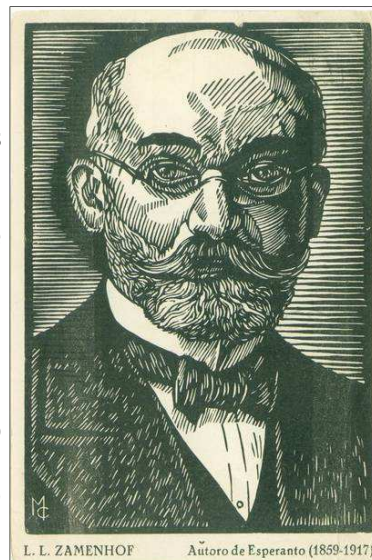
L. L. ZAMENHOF