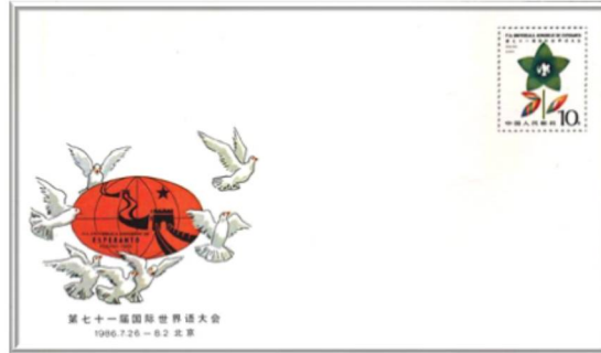
Tutaĵa koverto eldonita de la Ĉina Popola Respubliko okaze de la 71-a Universala Kongreso de Esperanto - 1986