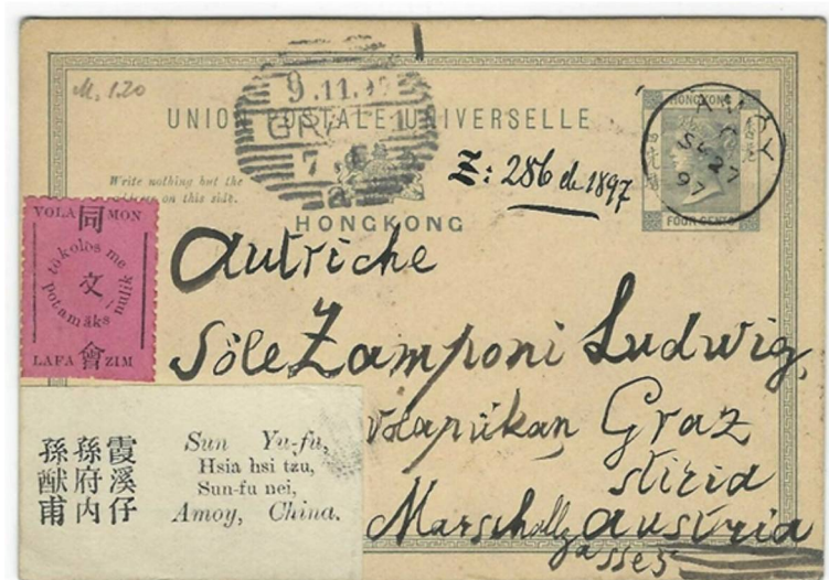
Glumarkoj sur Honkonga poŝtkarto 1897