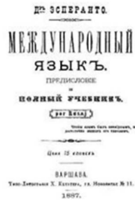
La unua libro Esperanto

La 26an de julio 1887 aperis la unua manlibro, en rusa lingvo, de "Internacia Lingvo" de D-ro Esperanto, nun nomata Esperanto, baldaŭ sekvis ankaŭ en la pola, germana, franca kaj angla traduko.