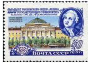
Sovietunio 1955, Moskva Universitato