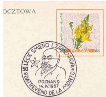
Pollando 1967, 50° datreveno de la morto