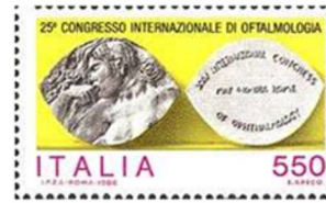
Italia 1986, Oftalmologio

La 26an de julio 1887 aperis la unua manlibro, en rusa lingvo, de "Internacia Lingvo" de D-ro Esperanto, nun nomata Esperanto, baldaŭ sekvis ankaŭ en la pola, germana, franca kaj angla traduko.