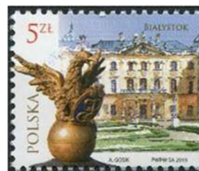
Pollando 2019, Bjalystok

La patro estis lingva instruisto kaj parolis kun sia filo en la rusa. Kun sia patrino, dommastrino, li parolis en la jida. Ekde infanaĝo, Ludoviko montris amon al lingvoj. Dum sian vivon li studis ĉirkaŭ ok aliajn lingvojn.