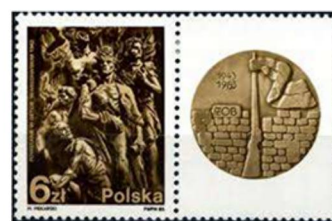
Pollando 1983, Varsovia geto

Dum la studadon ĉe la klasika gimnazio en Varsovio, Zamenhof komencis trakti la kreon de komuna lingvo, kiu ne apartenis al iu ajn popolo. Li tiam komencis longan preparan periodon, kiu permesis al li plibonigi la komencan projekton.