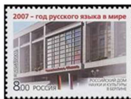
Rusio 2007, rusa lingvo

La patro estis lingva instruisto kaj parolis kun sia filo en la rusa. Kun sia patrino, dommastrino, li parolis en la jida. Ekde infanaĝo, Ludoviko montris amon al lingvoj. Dum sian vivon li studis ĉirkaŭ ok aliajn lingvojn.