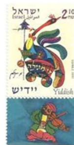
Israelo 2002, jida lingvo

En Bjalistoko vivis homoj de diversaj etnoj ne ĉiam laŭ paca maniero. Ĉi tiu fakto ege influis la junan Zamenhof, do la ideo pri neŭtrala lingvo ekprenis lin forte. En 1873 la familio translokiĝis al Varsovio en la juda geto, kie la patro de Ludoviko komencis instrui la germanan en la gimnazio, sed eĉ tie Ludoviko renkontis la samajn kontrastojn inter la malsamaj etnoj kaj komencis sperti fortan kontraŭjudismon.