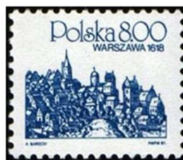
Pollando 1981, Varsovio en 1618

En Bjalistoko vivis homoj de diversaj etnoj ne ĉiam laŭ paca maniero. Ĉi tiu fakto ege influis la junan Zamenhof, do la ideo pri neŭtrala lingvo ekprenis lin forte. En 1873 la familio translokiĝis al Varsovio en la juda geto, kie la patro de Ludoviko komencis instrui la germanan en la gimnazio, sed eĉ tie Ludoviko renkontis la samajn kontrastojn inter la malsamaj etnoj kaj komencis sperti fortan kontraŭjudismon.