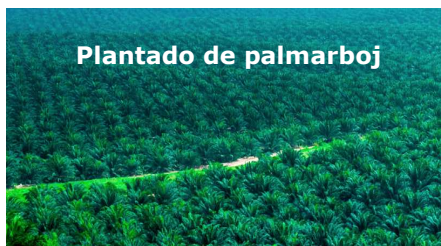
Plantado de palmarboj

igos 1.000-hektaran zonon en la okcidenta Kalimantan, indonezia parto en insulo Borneo: ĝi estas, ĉiuŝare, la plej brultrafita teritorio en la tuta Indonezio. Krome, laŭkomunike de Greenpeace , FGV strebos elimini la ekspluatadon de laboristaro en siaj palmejoj (tio sekve de denunc-enketo fare de Wall-