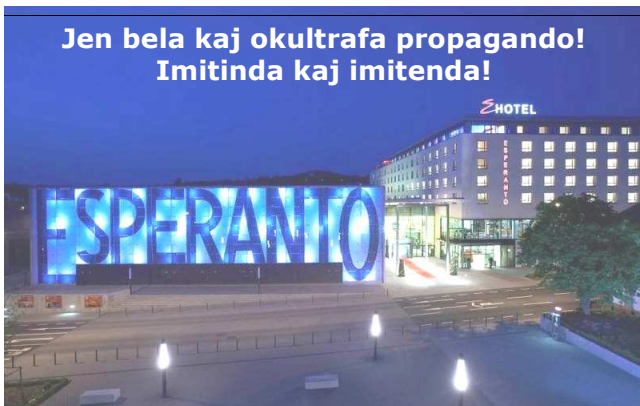
Jen bela kaj okultrafa propagando! Imitinda kaj imitenda!

Fontoj: (EdE, Vikipedio, Trovanto E-Muzeo en Vieno, Pola Esperantisto – 1934-35)