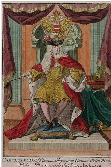
CAROLUS VI D. G. Roman. Imperator German. Hung. Bohem. Rex etc. Archid. Duc. Austriae.

Sed kio plej strangas - kiel mi diris komence de tiu ĉi elverŝado de pensoj kaj rememoroj - estas ke oni ree valorigis la uzadon de dialektoj kaj eĉ favoras iliajn konservadon kaj protektadon. Tio ĉi estimendas, ĉar malantaŭ la vortoj de iu ajn idiomato estas scioj: dialekto ne estas lingva koruptado, nek ia speco de norma kripligita lingvo.