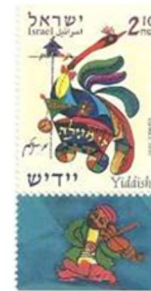
Israele 2002, la lingua yiddish

A Białystok vivevano persone di diversi gruppi etnici non sempre in modo pacifico. Questo fatto influenzò molto il giovane Zamenhof, per cui l'idea di una lingua neutrale si impossessò di lui con forza. Nel 1873 la famiglia si trasferì a Varsavia nel ghetto ebraico, dove il padre di Ludovico iniziò ad insegnare il tedesco al ginnasio, ma anche lì il giovane incontrò gli stessi contrasti fra i diversi gruppi etnici ed incominciò a sperimentare il devastante antigliudaismo.