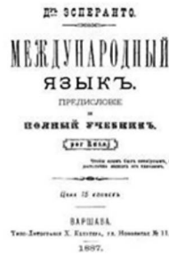
La prima grammatica di Esperanto

Il 26 luglio 1887 uscì il primo manuale, in lingua russa, della "Lingua Internazionale" del dottor Esperanto, oggi chiamata Esperanto, seguita presto anche in polacco, tedesco, francese e inglese.