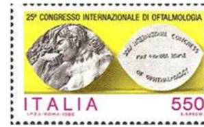
Italia 1986, Congresso Oftalmologia

Il 26 luglio 1887 uscì il primo manuale, in lingua russa, della "Lingua Internazionale" del dottor Esperanto, oggi chiamata Esperanto, seguita presto anche in polacco, tedesco, francese e inglese.