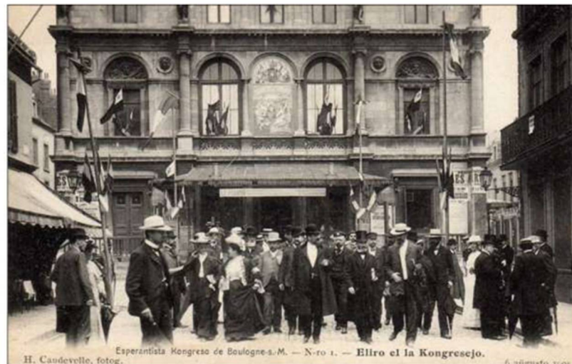
1905 - 1° Congresso Esperantista a Boulogne sur Mer La congressisti escono dalla sede del congresso

Da quel momento in poi iniziò a tradurre e scrivere testi in lingua internazionale e a intrattenere una fitta corrispondenza con i primi esperantisti. Nel 1905 in Francia, nella città di Boulogne-sur-Mer si tenne il primo Congresso Universale.