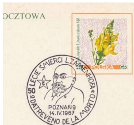
Polonia 1967, 50° anniversario della morte