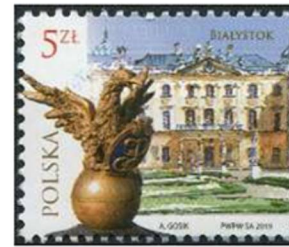
Polonia 2019, Białystok