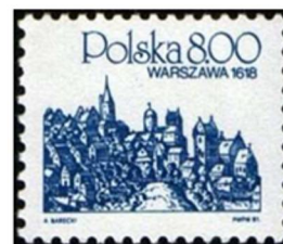
Polonia 1981, Varsavia nel 1618

A Białystok vivevano persone di diversi gruppi etnici non sempre in modo pacifico. Questo fatto influenzò molto il giovane Zamenhof, per cui l'idea di una lingua neutrale si impossessò di lui con forza. Nel 1873 la famiglia si trasferì a Varsavia nel ghetto ebraico, dove il padre di Ludovico iniziò ad insegnare il tedesco al ginnasio, ma anche lì il giovane incontrò gli stessi contrasti fra i diversi gruppi etnici ed incominciò a sperimentare il devastante antigliudaismo.