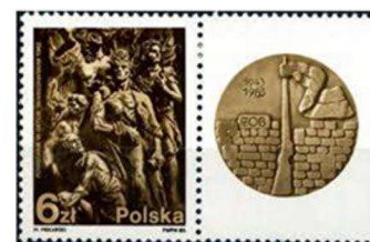
Polonia 1983, Ghetto

Frequentando il ginnasio classico di Varsavia, Zamenhof iniziò ad occuparsi della creazione di una lingua comune ma che non appartenesse ad alcun popolo. Intraprese allora un lungo periodo di preparazione che gli permise di migliorare il progetto iniziale.