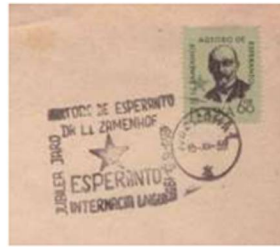
Polonia 1959, 100 anni dalla nascita

Lejzer Ludwik Zamenhof nacque, da una famiglia di origine ebraica il 15 dicembre 1859 nella città di Białystok, allora nell'Impero Russo, ora in Polonia.