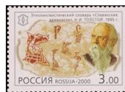
Lev Tolstoj - Ĉeĥoslovakio 1953 kaj Rusio 2000