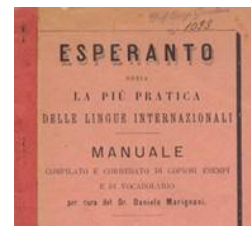
1890 - Titolpaĝo de la unua itala manlibro

Komence de la 20a jarcento okazas pluraj internaciaj kunvenoj, ĝis kiam la unua monda kongreso estas organizita en 1905, en Bulonjo-sur-Maro. La sukceso pliiĝas kaj, en aprilo 1908, Universala Esperanto-Asocio ( kiu ekzistas ankoraŭ hodiaŭ) estas fondita de la dudekunu-jara Hector Hodler, svisa ĵurnalistino, kune kun aliaj liaj kolegoj.