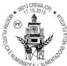
Italio - Marignoni naskiĝas en Kremio

Baldaŭ la Esperanta manlibro estas tradukita al multaj aliaj lingvoj. En Italio, en 1890, la unua gramatiko estas publikigita de Daniele Marignoni el Kremio. Danke al ĉi tiu eldonaĵo kaj la ĉeesto de multaj spertuloj, grupoj naskiĝas en multaj urboj tra la tuta Italujo.