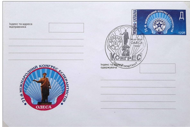
1998 - Odeso, Ukraino - Tutaĵo - 71 a SAT-Kongreso,