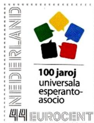
Nederlando - aprilo 2008 100 jaroj de UEA (personigita poŝtmarko)

Komence de la 20a jarcento okazas pluraj internaciaj kunvenoj, ĝis kiam la unua monda kongreso estas organizita en 1905, en Bulonjo-sur-Maro. La sukceso pliiĝas kaj, en aprilo 1908, Universala Esperanto-Asocio ( kiu ekzistas ankoraŭ hodiaŭ) estas fondita de la dudekunu-jara Hector Hodler, svisa ĵurnalistino, kune kun aliaj liaj kolegoj.